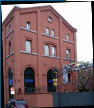
Brauhaus mit Tradition: Brauerei Hensen in MG